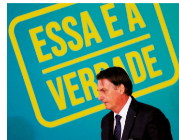
Ruim ou péssimo?

Abandonados pelo governo, guerreiros indígenas xikrins retomaram área invadida por centenas de grileiros que estavam desmatando área no Pará.