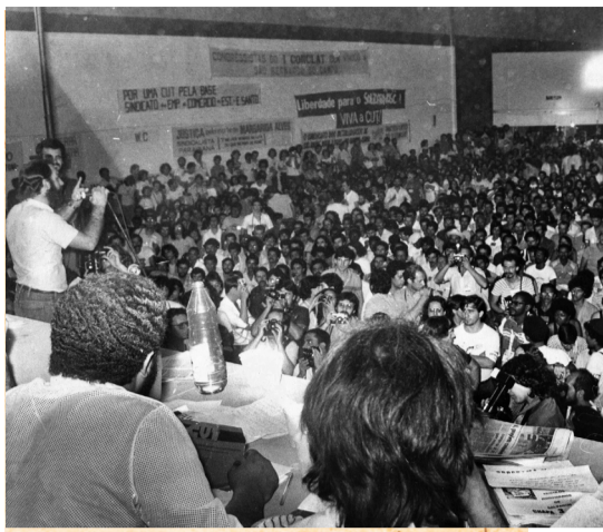
Congresso de fundação da CUT no galpão da extinta companhia cinematográfica Vera Cruz, em São Bernardo do Campo, em 1983