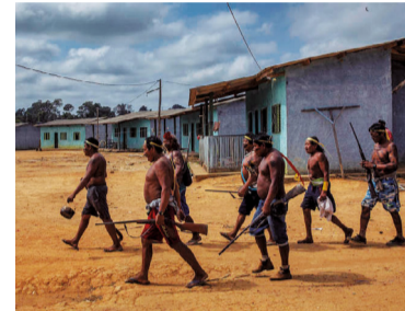
Assim que se faz

O Governo rejeitou quase R$ 90 milhões do G7 para auxiliar no combate às queimadas na Amazônia. Bolsonaro aceitou oferta do governo israelense.